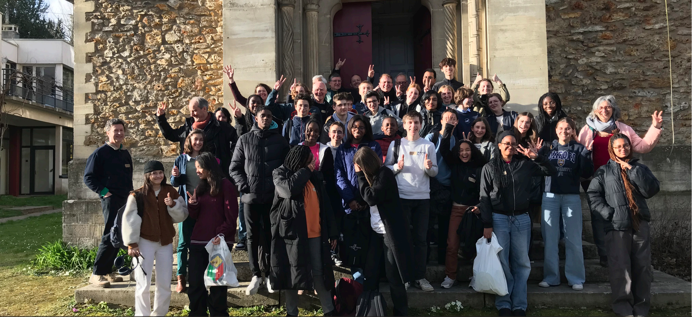
Journée spéciale KT4 à la paroisse de Jouy-en-Josas le samedi 25 mars 2023, organisée par notre consistoire. Quelques paroisses du consistoire Boucles de Seine Ouest se sont jointes à nous (Le Vésinet, Marly le Roi, Rueil). Ce fut une très belle journée !